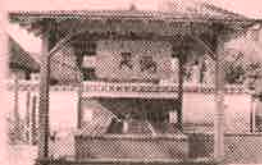
【足湯 (山田家本屋前)】