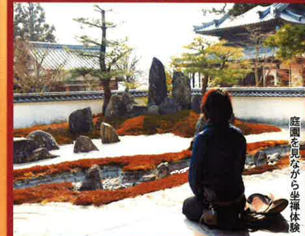
庭園を見ながら坐禅体験