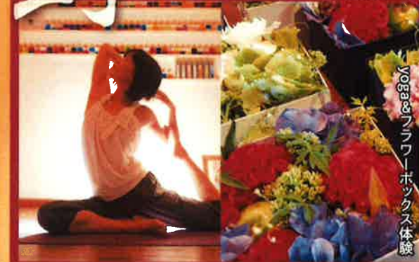
Yoga&フラワーボックス体験