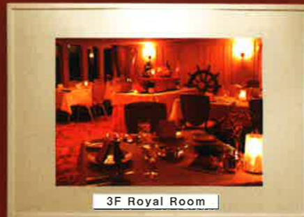
3F Royal Room